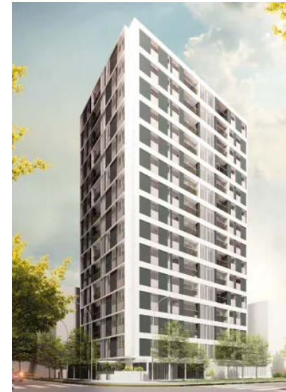
Las Camelias Santa Beatriz