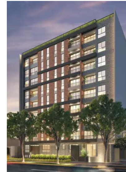
More Jesús María