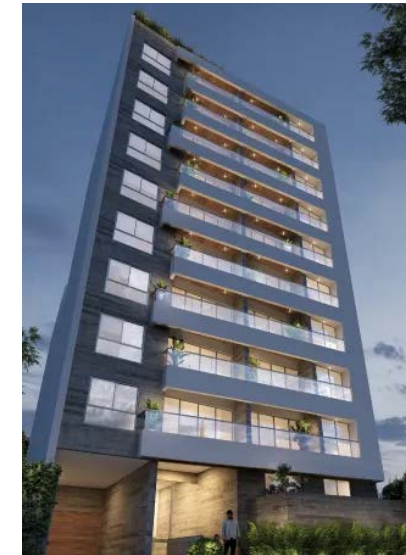
Plus Jesús María