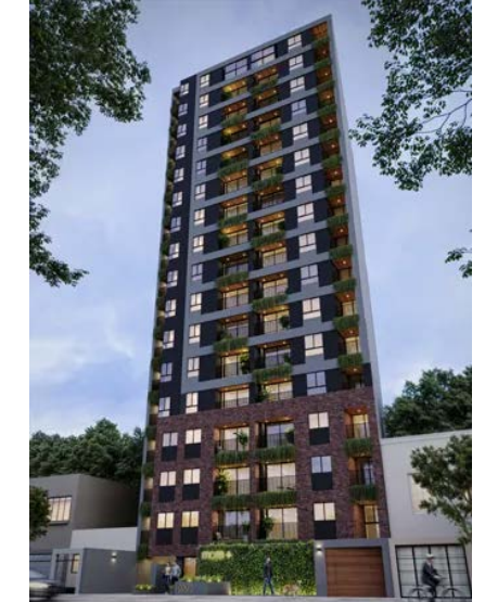
More+ Jesús María